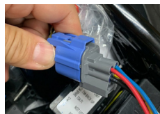
4Pカプラーキャップを外して、電源取り出しハーネス type2 を取り付けます。