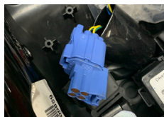
車体後部シート下コネクタカバーの中の4Pカプラーを取り出す

※ハーネスのギボシ端子には、CA/CB 103 (ホンダ) メスギボシを使用しています。 K・CON : ギボシ端子セット (CA/CB 103 / ホンダ) (右下参照) 商品コード: 0900-755-01000 税込価格: ¥440 本体価格: ¥400 JANコード: 4990852039852 ●オス/メスギボシ端子...各5 オス/メススリーブ...各5